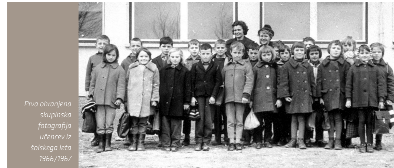
Prva ohranjena skupinska fotografija učencev iz šolskega leta 1966/1967

je bilo premajhno število učencev v omenjenih vaseh. Tako se je število učencev v šolskem letu 1972/1973 povečalo na 605.