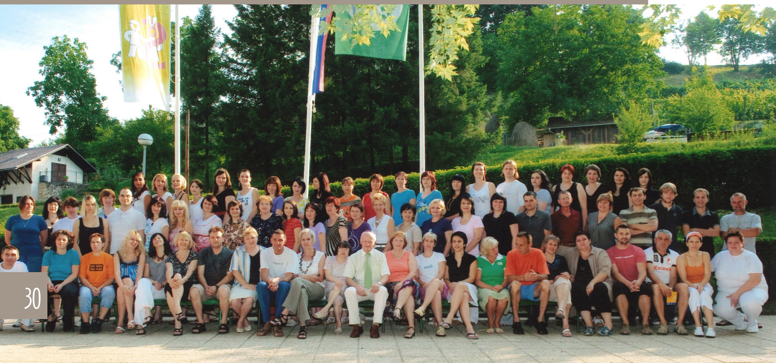
Kolektiv Osnovne šole Metlika v šolskem letu 2009/2010