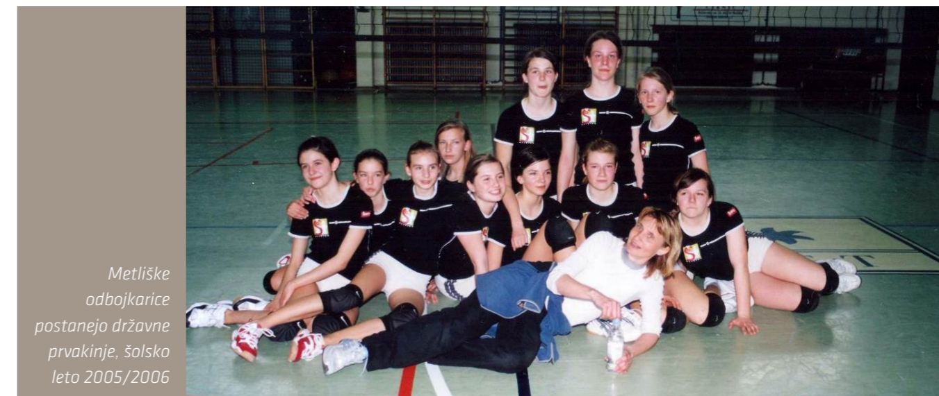
Metliške odbojkarice postanejo državne prvakinje, šolsko leto 2005/2006

priznanje na državni ravni. Z leti pa so se tekmovanja razširila tudi na ostala predmetna področja, kjer so učenci dosegali zavidljive uspehe, ne smemo pozabiti niti številnih uspešnih raziskovalnih nalog tako z družboslovnega kot naravoslovnega področja. Učenci so se izkazali tudi na likovnem, glasbenem, literarnem in športnem področju. V ekipnih športih metliški fantje še vedno slovijo kot izjemni rokometaši in nogometaši, dekleta pa so odlične odbojkarice.