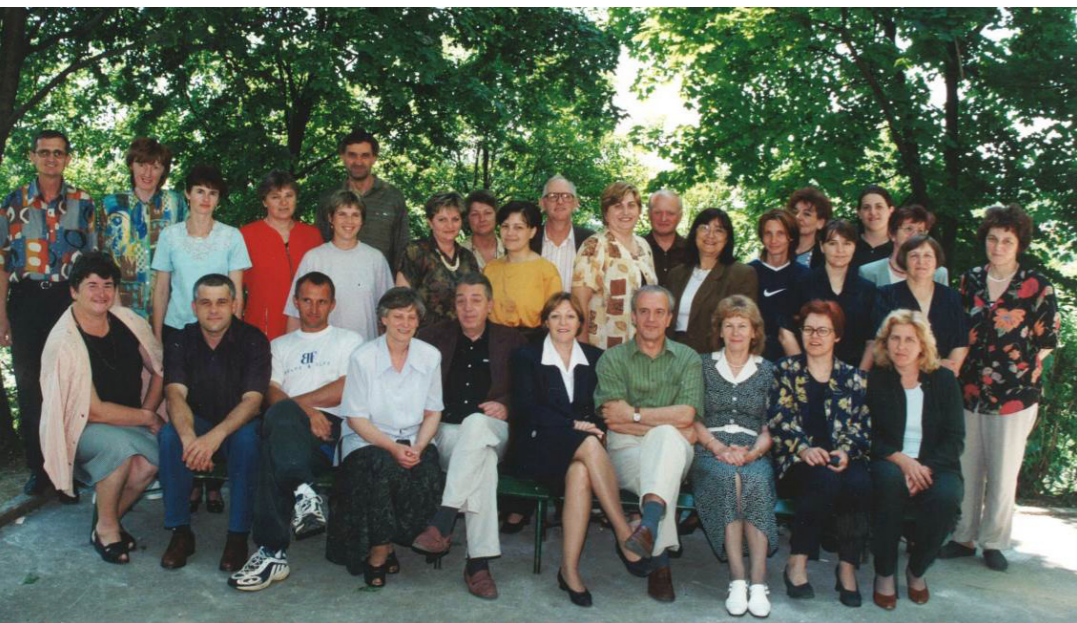
Kolektiv Osnovne šole Metlika v šolskem letu 1998/1999