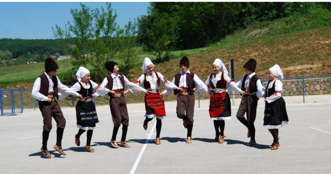
Gostovanje učencev beogradske Osnovne šole Jovana Sterije Popovića pri nas

V šolskem letu 2009/2010 se je šola povezala z Osnovno šolo Jovana Sterije Popovića iz Beograda. Šoli sta podpisali listino o sodelovanju na pedagoškem področju.