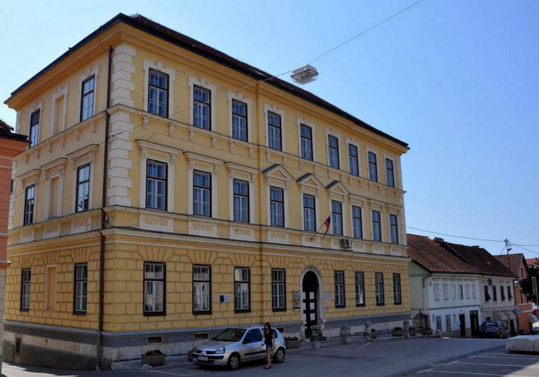
Stavba na Partizanskem trgu, v kateri je delovala stara šola

je poučevalo pet učiteljev in ena učiteljica. V prvem šolskem letu, tj. 1888/1889, je v novi stavbi pouk obiskovalo 506 učencev: v prvem razredu 132, v drugem 105, v tretjem 93 in v četrtem tudi 93. Poleg štirih razredov je obstajala še ponavljalna šola, ki jo je obiskovalo 113 učencev. Še istega leta so se pripravljali na uvedbo šestrazrednice. Leta 1911 je za potrebe šolske telovadbe dobila v najem sokolsko telovadnico. V tej stavbi je danes Slovenski gasilski muzej. Leta 1921 je šola postala osemletna. Pouk je potekal na Gornjem trgu (danes Partizanski trg).