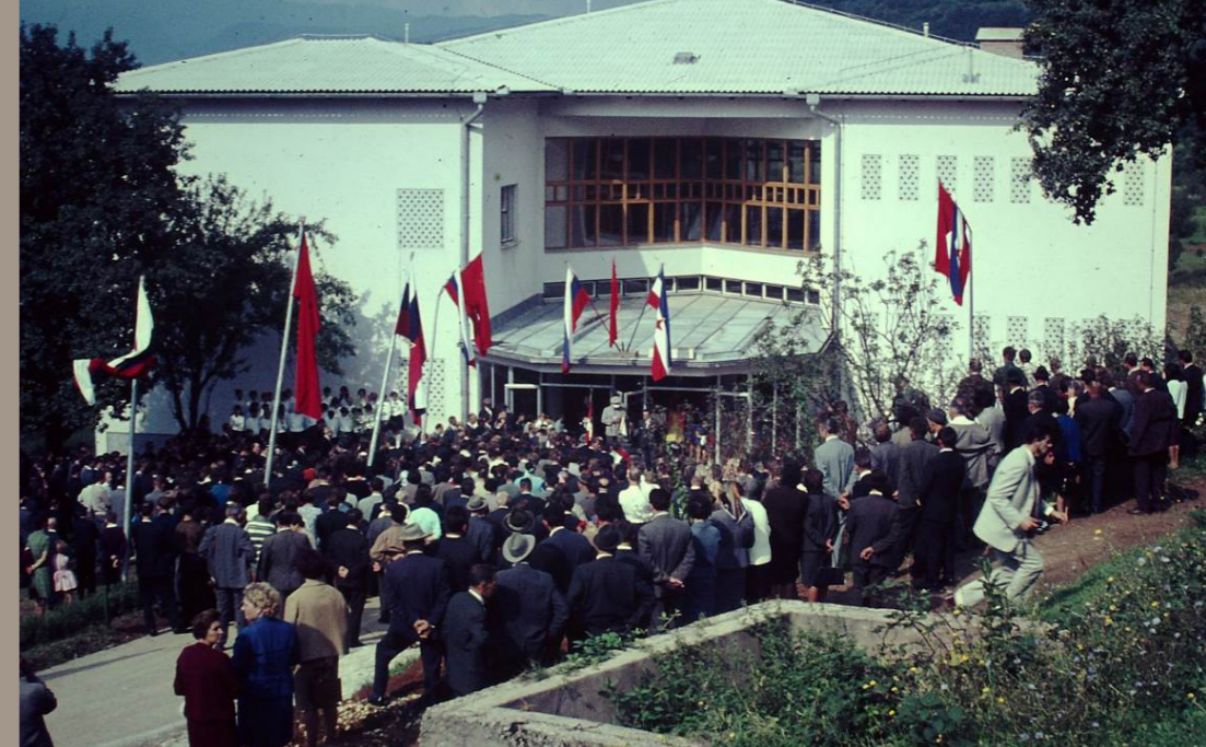
Slovesnost ob preimenovanju šole 1. septembra 1968

Šola se je 1. septembra 1968 preimenovala v XV. SNOUB Belokranjsko.