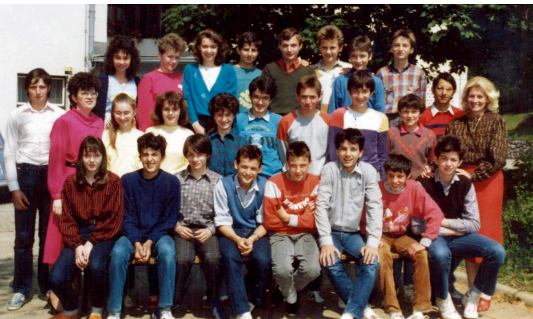
Fotografija osmošolcev iz šolskega leta 1986/1987

Rast števila učencev se je nadaljevala do leta 1987/1988, ko je imela šola 733 učencev, kar je najvišje število v njeni zgodovini. Po letu 1989 se je število učencev začelo zmanjševati, tako je šola ob osamosvojitvi Slovenije štela 679 učencev.