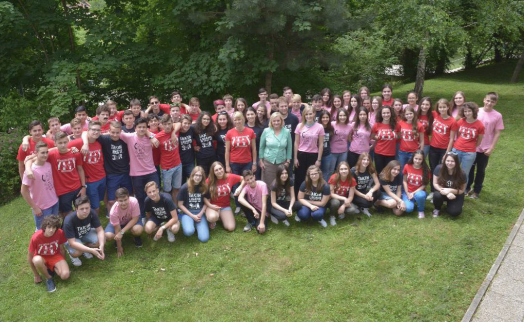
Zaključna generacija devetošolcev iz šolskega leta 2015/2016

V šolskem letu 2016/2017 je šola dobila tudi novo podobo.