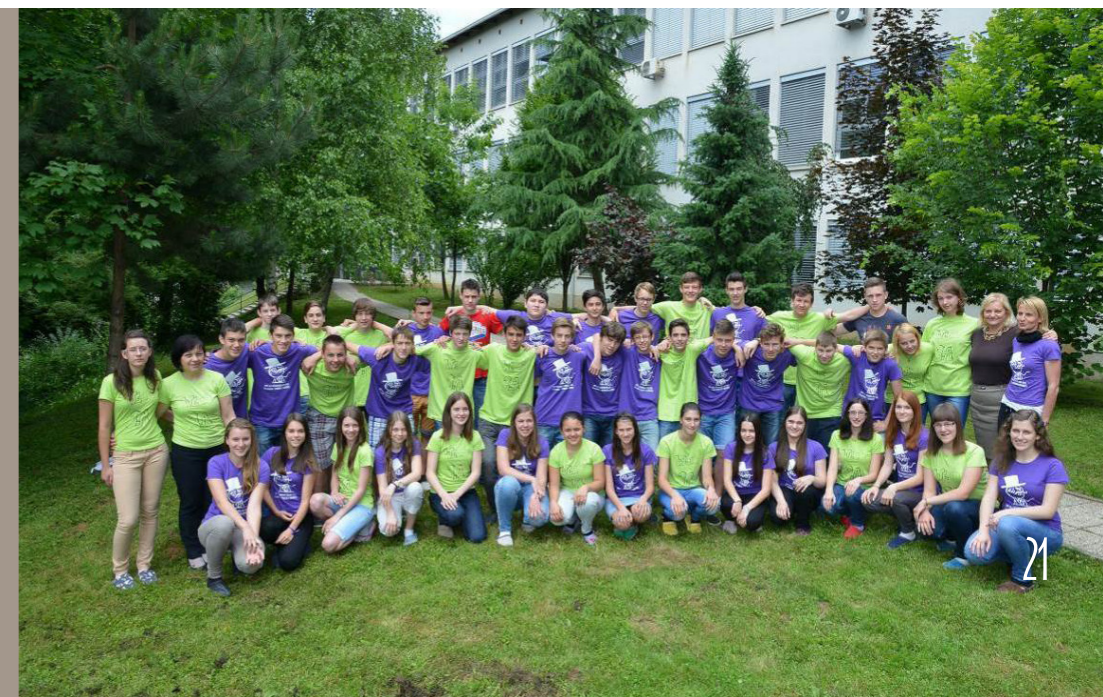
Zaključna generacija devetošolcev iz šolskega leta 2013/2014