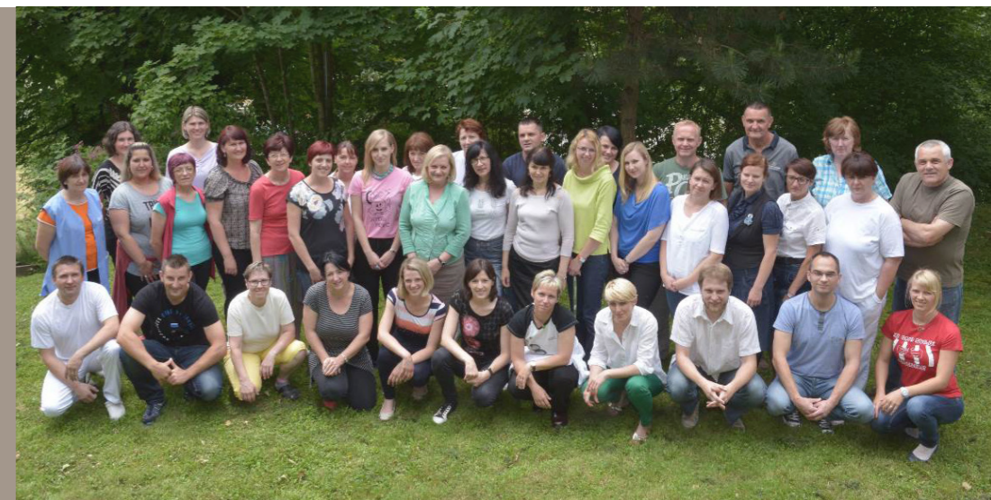
Kolektiv Osnovne šole Metlika šolskem letu 2015/2016