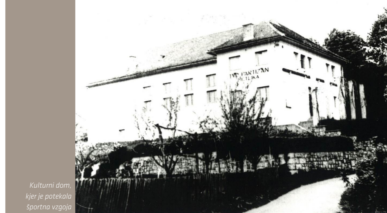
Kulturni dom, kjer je potekala športna vzgoja

Po drugi svetovni vojni je del pouka potekal tudi v gradu. Učilnice so bile v prvem nadstropju v sobah, v katerih sta danes sprejemnica in arheološki oddelek Belokranjskega muzeja. Nekaj učilnic je bilo še v pritličju. V prvem nadstropju je delovala mlečna kuhinja. Malico so delili na hodniku v prvem nadstropju gradu. Učenci iz šole na Partizanskem trgu so hodili (tekli) na malico v grad. Kasneje se je kuhinja preselila v prostor, v katerem je danes Ganglovo razstavišče. Poleg malic so učenci lahko dobili tudi kosilo. Tukaj je bila tudi jedilnica.