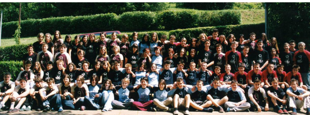
Prva zaključna generacija devetletke, šolsko leto 2001/2002

V prvem desetletju po osamosvojitvi je šola beležila velik padec števila učencev. Leta 2001/2002 je šola obiskovalo le 587 učencev. Že naslednje leto se je število učencev nekoliko povečalo, ker je šola začela obiskovati prva generacija, ki je z devetletko začela osnovnošolsko izobraževanje. Število oddelkov se je povečalo, s tem pa tudi število učencev na 625.