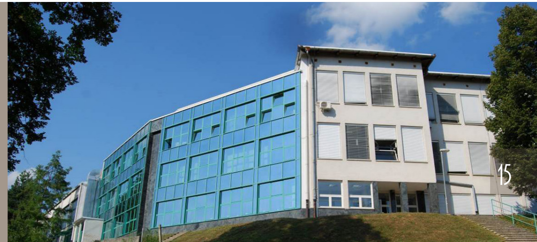
Prizidek k šoli, zgrajen v začetku šolskega leta 2001/2002

V začetku devetdesetih let so se začele prve pobude za širitev šole, saj je pouk potekal v dveh izmenah. Šola si je prizadevala za izgradnjo prizidka, ki bi vsem učencem omogočil dopoldanski pouk in uvajanje devetletke. Avgusta 2000 je bila podpisana pogodba s podjetjem Beograd za izgradnjo prizidka, ki je bil končan v začetku šolskega leta 2001/2002. V njem so: učilnice za razredni pouk, prilagojene potrebam devetletne osnovne šole, učilnici za računalništvo in likovno vzgojo, knjižnica, jedilnica, kuhinja, garderobe in sanitarije. S tem se je končal izmenski pouk.