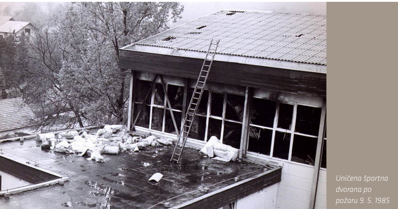
Uničena športna dvorana po požaru 9. 5. 1985

Čeprav je bila nova šolska stavba za Metliko velika pridobitev, pa je bila velika pomanjkljivost, da v začetku ni imela športne dvorane. Pouk telesne vzgoje se je ob primernem vremenu odvijal na igrišču na Pungartu, sicer pa v Kulturnem domu. Že v šolskem letu 1975/1976 so se začele priprave na gradnjo nove športne dvorane, ki je bila odprta na občinski praznik 26. 11. 1977. Toda sodobno športno dvorano je 9. 5. 1985 uničil požar. Škode je bilo za 20 milijonov takratnih dinarjev. Potrebno je bilo zgraditi novo športno dvorano.