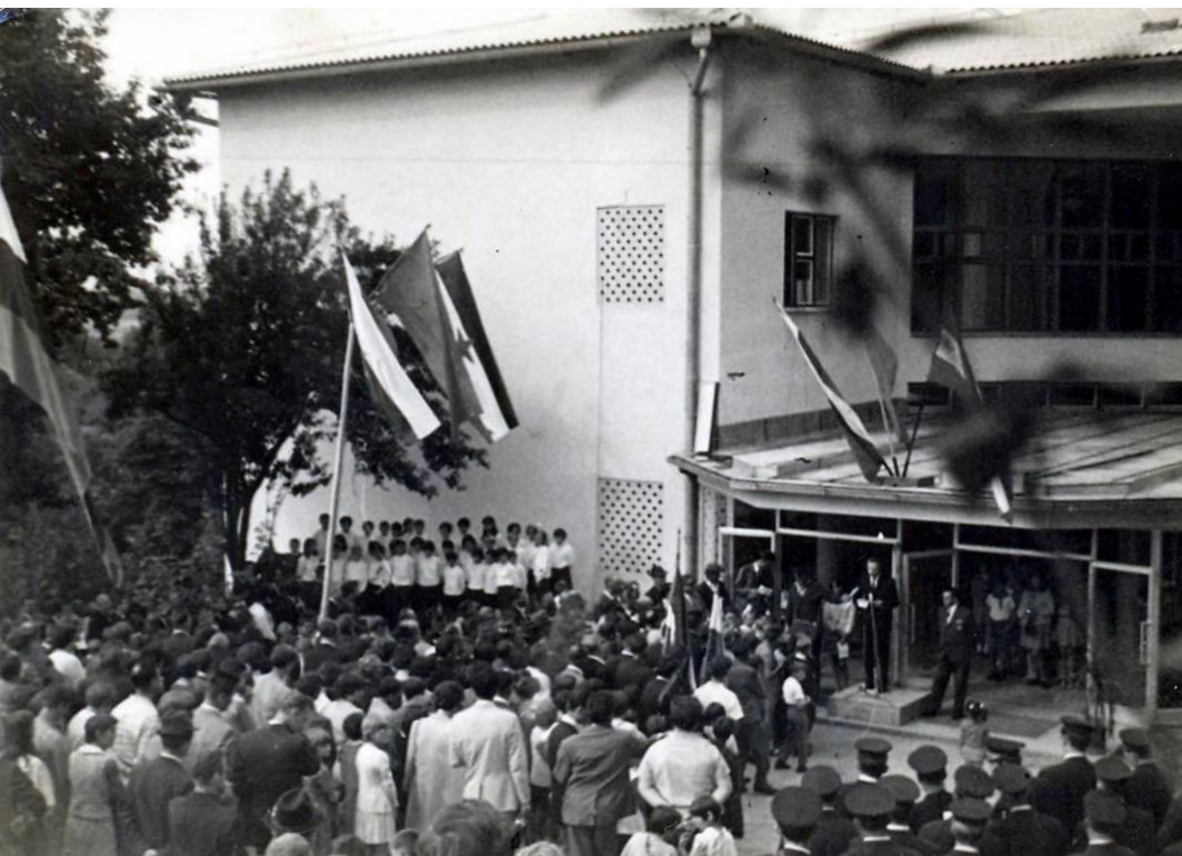
Slovesno odprtje nove šole 18. 9. 1966