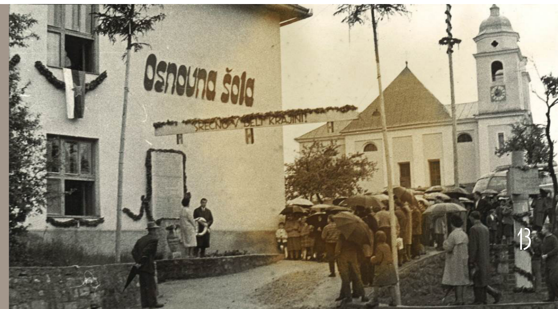
Podružnična šola na Suhorju

S šolskim letom 1971/1972 je šola na Suhorju postala podružnična šola. V šolskem letu 1972/1973 so bile ukinjene podružnične šole Božakovo, Drašiči in Radovica. Osnovna šola v Metliki je postala centralna šola, v njenem sestavu sta bili podružnična šola Suhor in Vzgojno-varstveni center Metlika ali otroški vrtec, ki se je 1. 1. 1979 odcepil od šole in postal samostojna delovna organizacija.