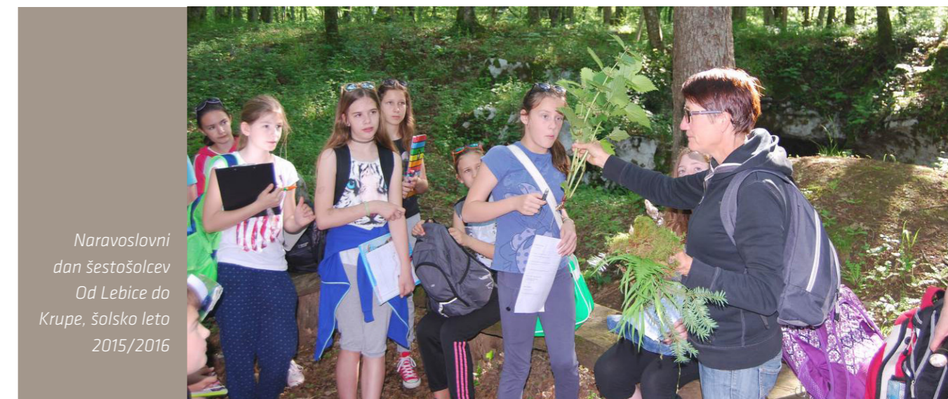
Naravoslovni dan šestošolcev Od Lebice do Krupe, šolsko leto 2015/2016

Besedilo o osnovnem šolstvu v Metliki napisala: Anton Bezenšek in Bojan Vukšinič.