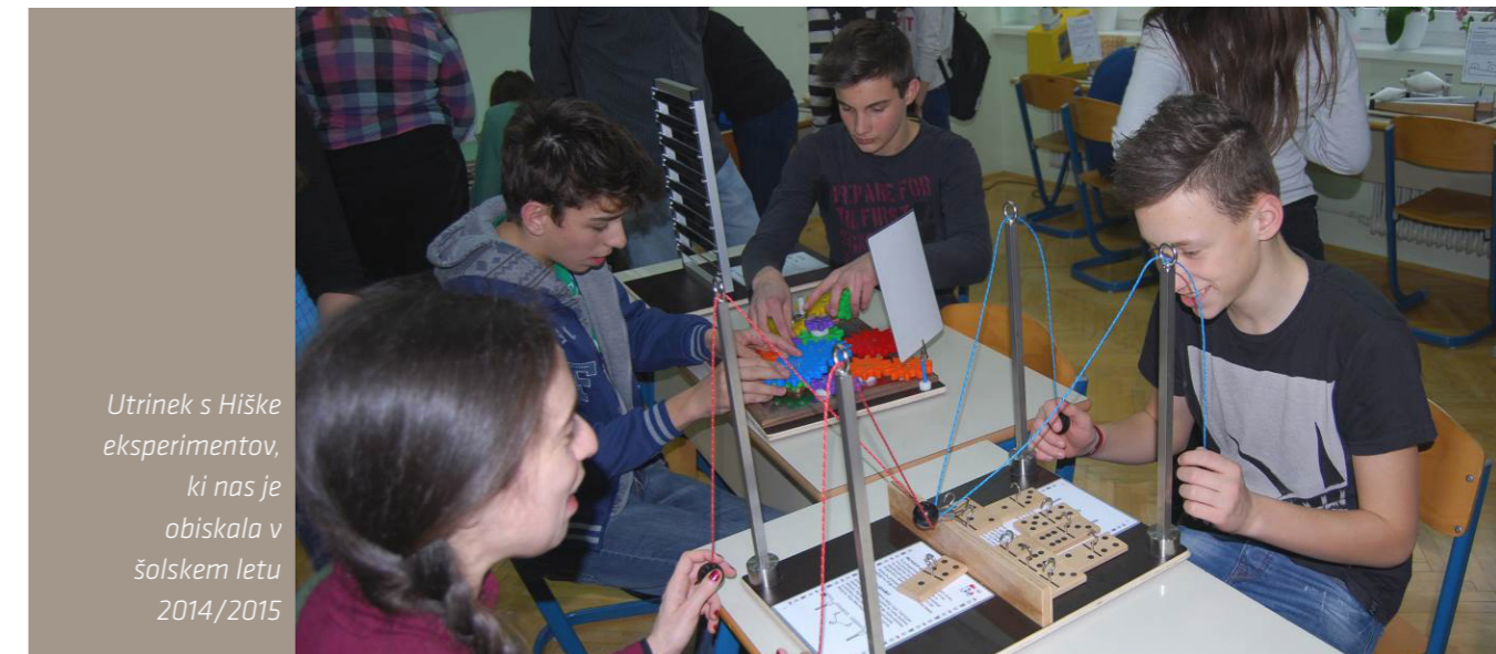
Utrinek s Hiške eksperimentov, ki nas je obiskala v šolskem letu 2014/2015

Pouk posodabljammo z eksperimentalnim in projektnim delom, s sodobnimi pedagoškimi metodami v inovativnih učnih okoljih.