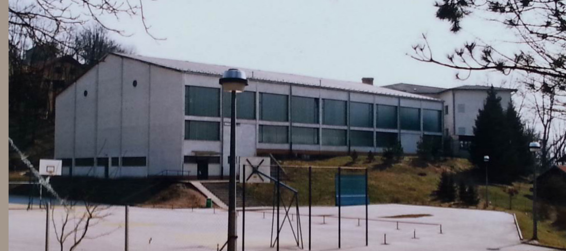
Nova športna dvorana, ki je bila odprta 26. 11. 1986

Po osamosvojitvi Slovenije se je šola preimenovala v Osnovno šolo Metlika.