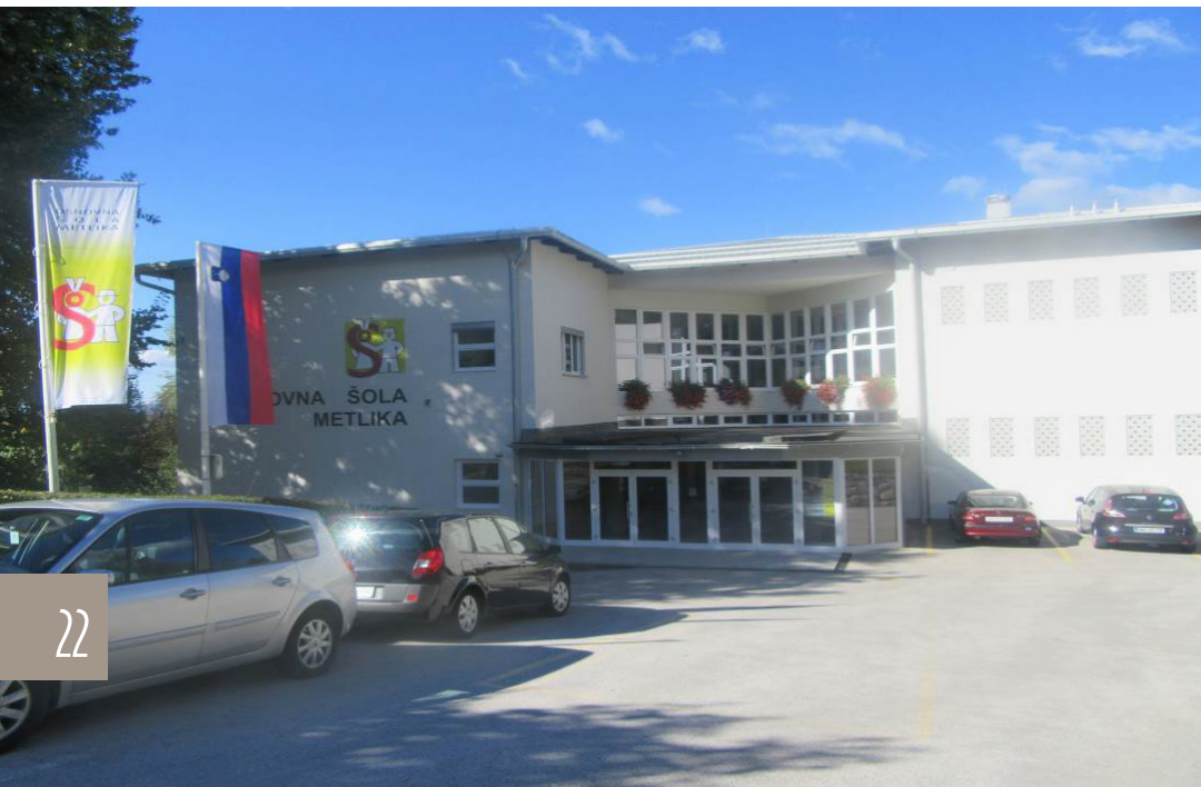
Prenovljeno šolsko pročelje z vhodom, avgust 2016

V šolskem letu 2016/2017 je šola dobila tudi novo podobo.