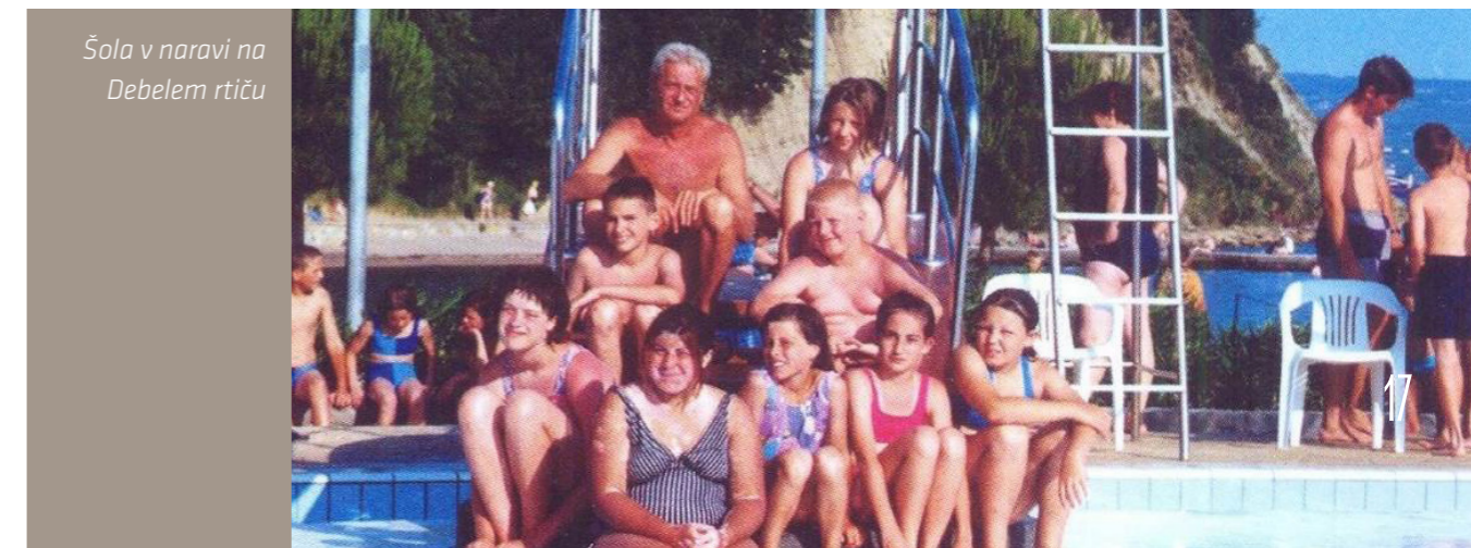
Šola v naravi na Debelem rtiču

Metliška šola se je vedno med prvimi vključevala v napredne oblike izvajanja pouka in razne projekte, ki so obogatili kvaliteto šolskega dela. To dokazuje tudi šola v naravi, ki se je od leta 1979 do 2008 izvajala na Debelem rtiču.