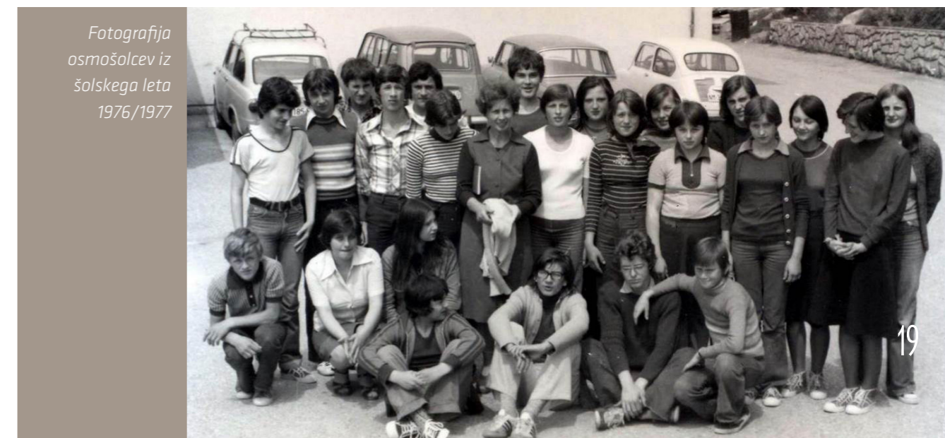
Fotografija osmošolcev iz šolskega leta 1976/1977

V sedemdesetih letih 20. stoletja se je zaradi demografske rasti prebivalstva število učencev vsako leto nekoliko povečevalo in v šolskem letu 1979/1980 je šolo obiskovalo že 706 učencev.