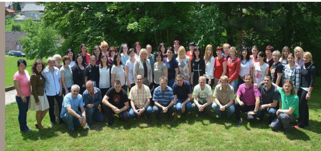
Kolektiv Osnovne šole Metlika v šolskem letu 2013/2014