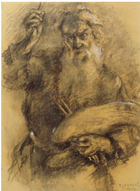
Rihard Jakopič. Avtoportret