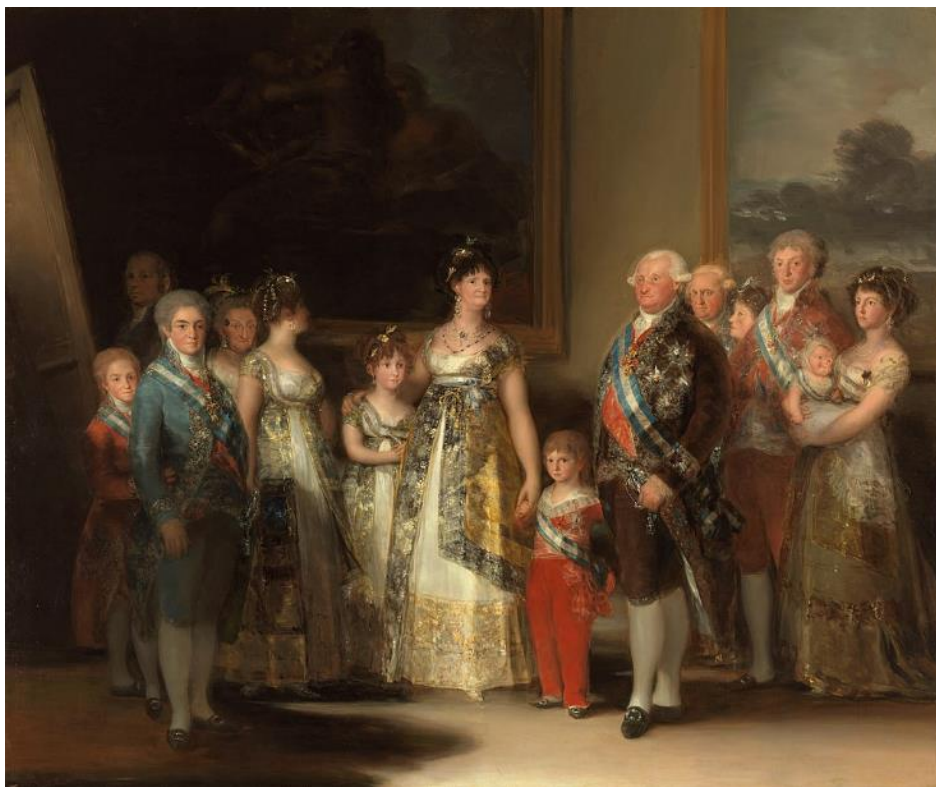
Francisco de Goya: Karel IV. Z družino

Prikazuje več ljudi v skupini, ki so tako ali drugače povezani (skupina prijateljev, sošolcev, družina, ...).