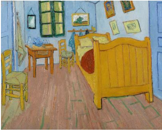
Vincent van Gogh: Soba