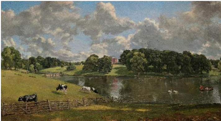
John Constable: Park Wivenhoe