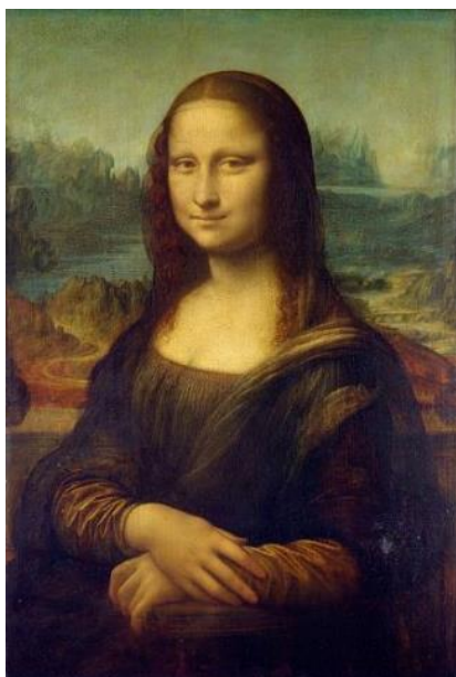
Leonardo da Vinci: Mona Lisa