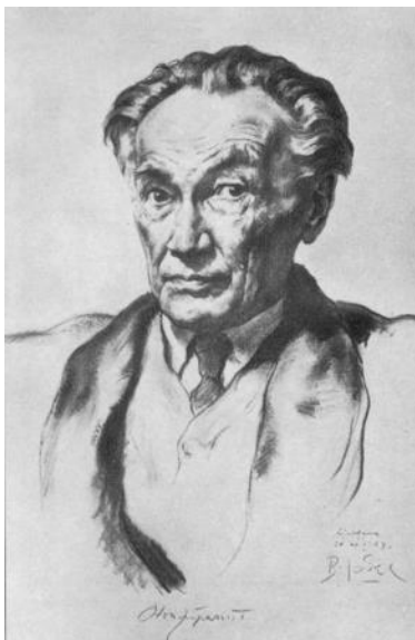
Božidar Jakac: Portret Otona Župančiča

je motiv likovnega dela, ki prikazuje osebo. Lahko je prikazana v risbi, v sliki, v grafiki, fotografiji, tudi kot kip.