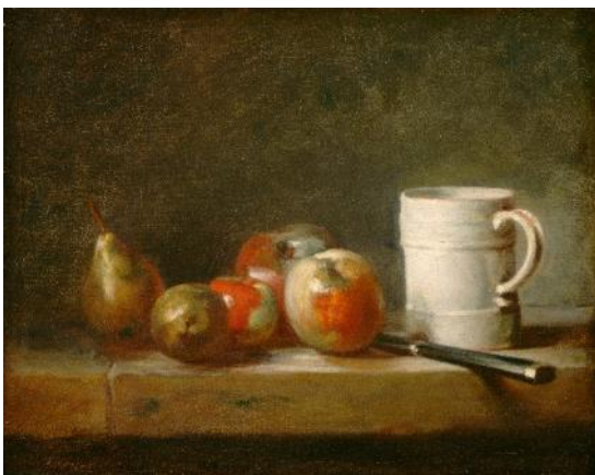
Jean-Baptiste-Simeon Chardin: Tihožitje z belim vrčem