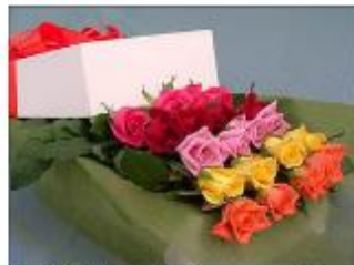
Slika 1: Vrtnice so lahko romantično darilo