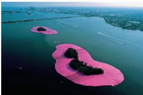
Sourounded Island, Florida

Legendi instalacij in land arta sta umetnika Christo in Jeanne-Claude.