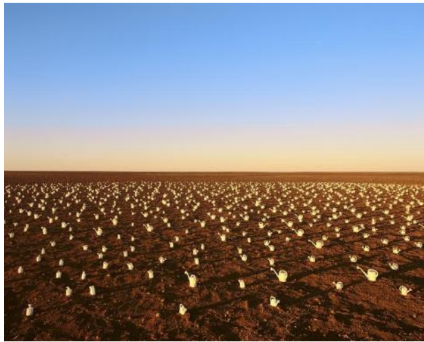
Moon Plain, južna Avstralija