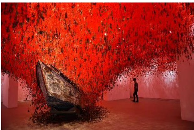
The Key In Hand, Benetke