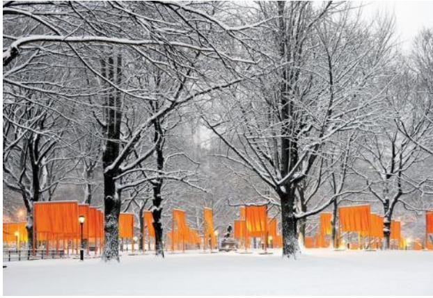
Gates, New York